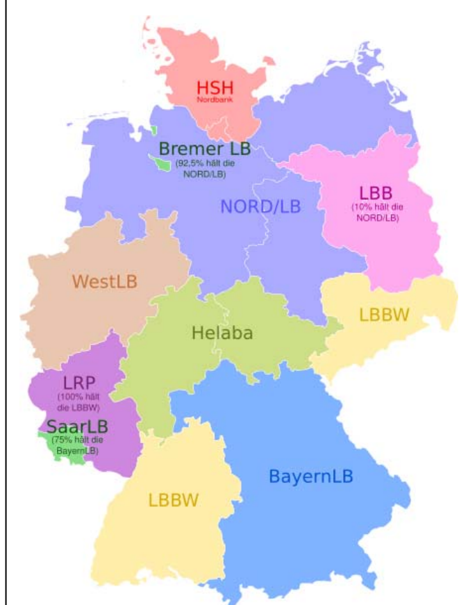
Grafik 1: Landesbanken in Deutschland

Die Landesbanken sind meistens gemeinsames Eigentum der jeweiligen Bundesländer und der regionalen Sparkassenverbände, dabei gibt es aber regionale Unterschiede. So haben die Länder Rheinland-Pfalz, Mecklenburg-Vorpommern, Sachsen, Brandenburg und Berlin inzwischen keinerlei Anteil an einer Landesbank mehr. Berlin stellt eine besondere