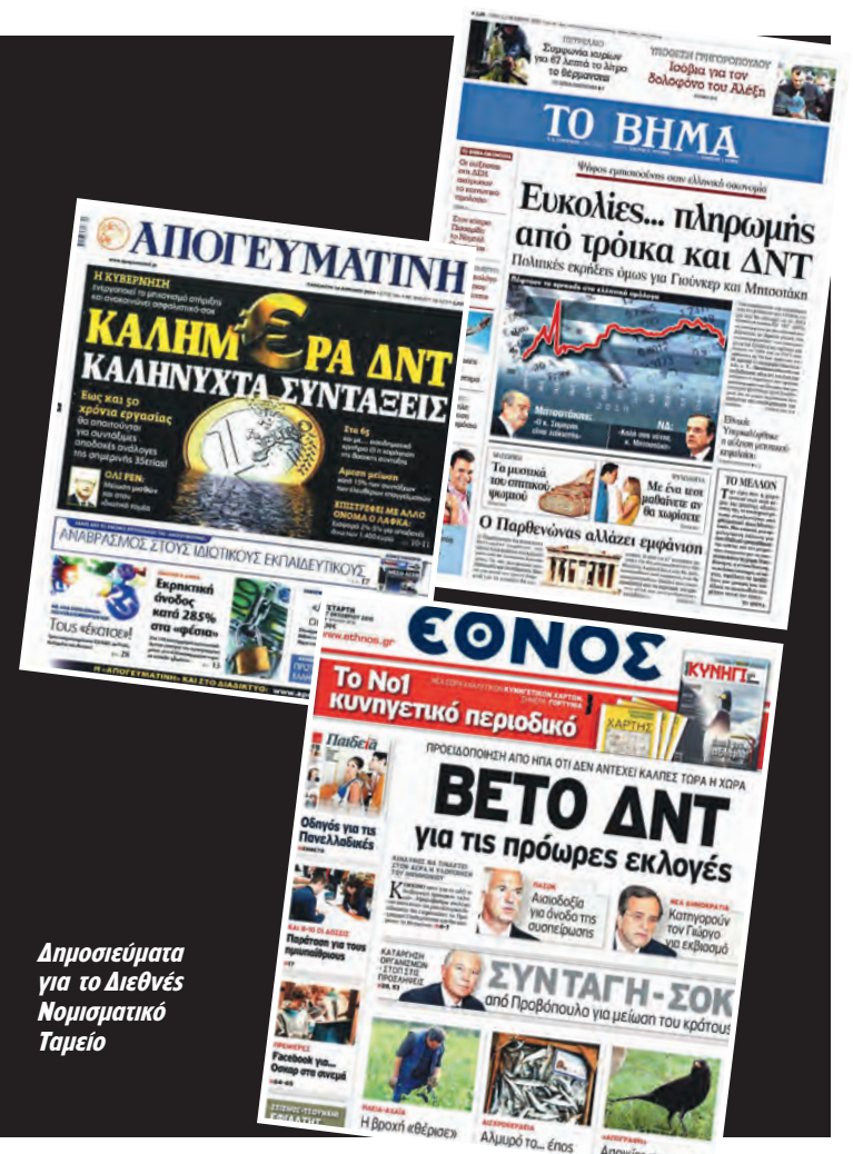
Δημοσιεύματα για το Διεθνές Νομισματικό Ταμείο

Το θρίλερ του ΔΝΤ σιγά σιγά άρχισε να γίνεται μπαμπούλας αλλά και... ανάσα στα ΜΜΕ, ειδικά μετά την αποστολή της υπογραφής Σαμαρά και τη συγκρότηση της κυβέρνησης Παπαδήμου, μέχρι που πήρε τη μορφή σωτήρα ή έστω αναγκαίου και χρήσιμου κακού στη σωτηρία της χώρας κατά τη διακυβέρνηση Σαμαρά-Βενιζέλου.